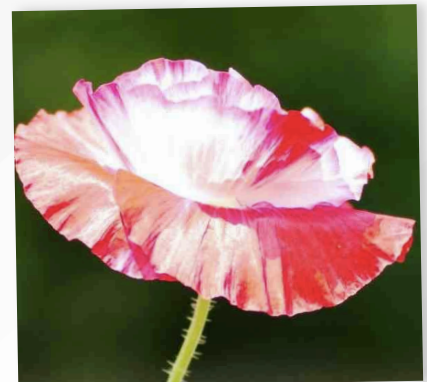
NACHHALTIG ERFOLGREICHE KOMMUNIKATION